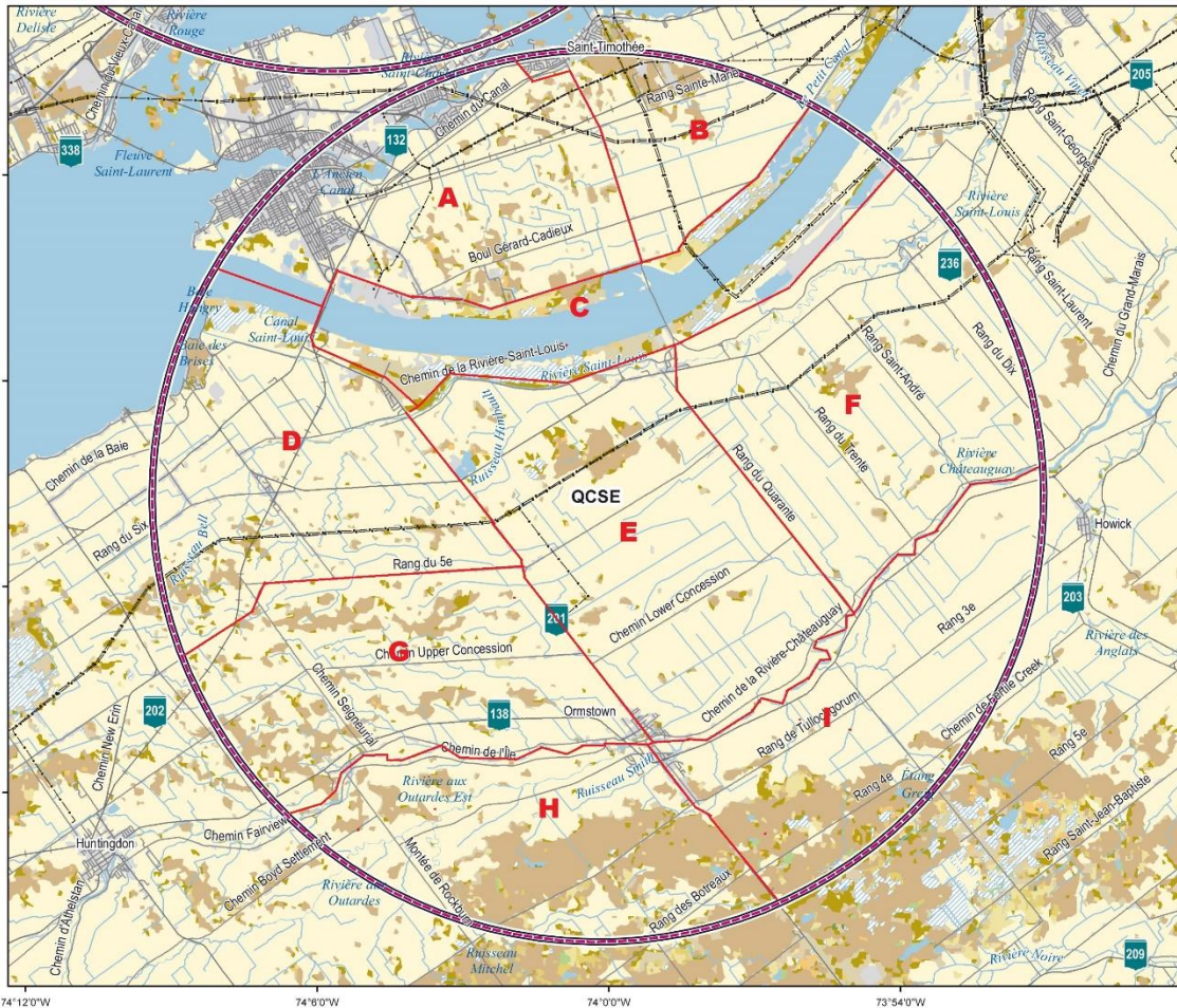
QCSE - St-Timothee