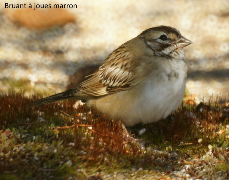
Bruant à joues marron

Samuel Denault a effectué les relevés visuels de l'Observatoire d'Oiseaux de Tadoussac (OOT) pendant onze saisons. À l'affût de la présence d'oiseaux rares, il a eu la chance d'accumuler des découvertes et des observations exceptionnelles de différentes espèces au fil des ans. La présence d'espèces égarées demeure